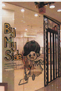
透明玻璃上的 KAKA 很搶眼，請留意入口上方，另一個 KAKA 在偷望你。